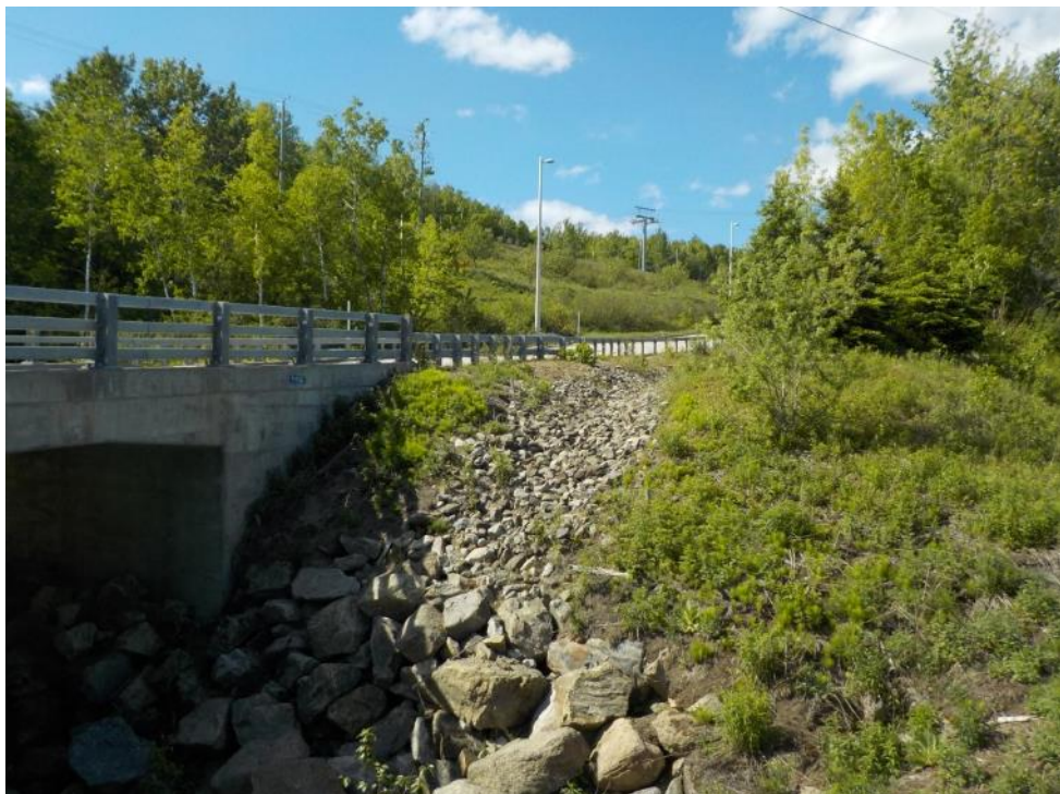
Image 2. Voie ferrée au-dessus du ruisseau de la Grande-Pointe