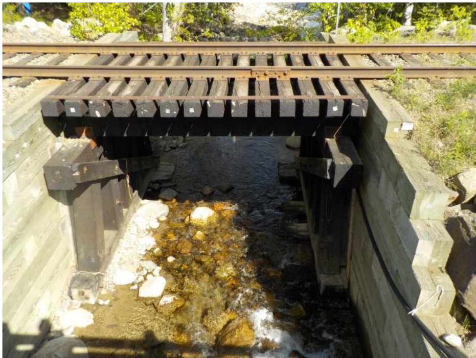
Image 1. Pont au-dessus du ruisseau de la Grande-Pointe